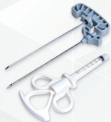
Vertebroplasty Set Code No. 33112