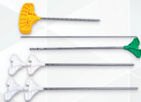
Kyphoplasty Set Code No. 33111