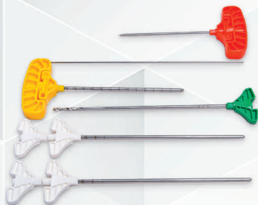
Kyphoplasty Set Code No. 33110