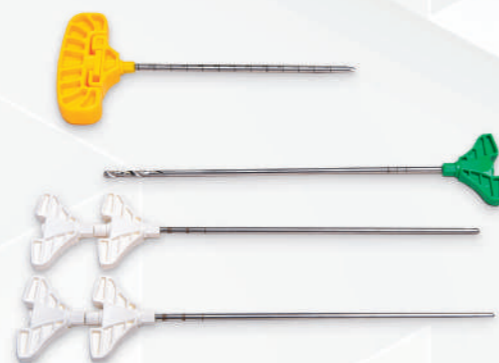
Kyphoplasty Set Code No. 33113